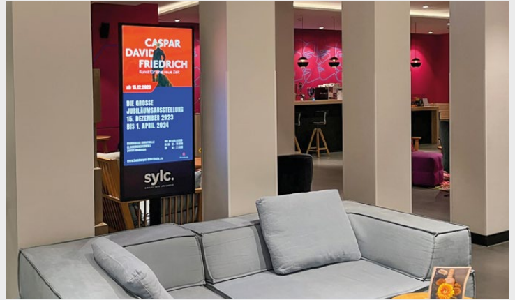
sylvic. Apartmenthotel Hamburg