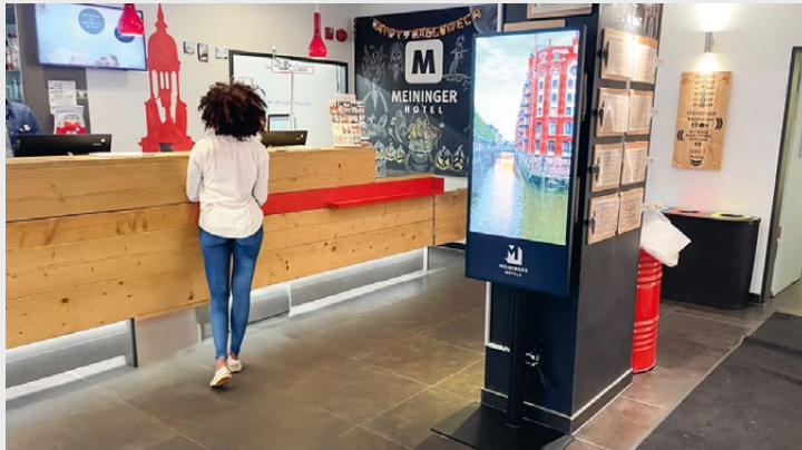
MEININGER Hotel, Hamburg