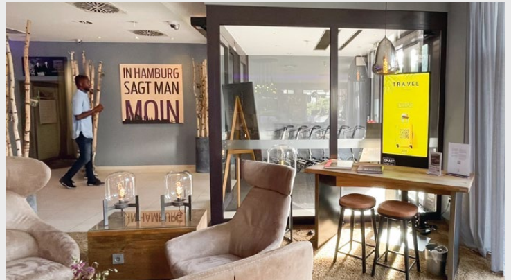
Mercure Hamburg City