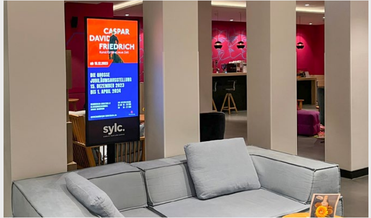
sylv. Apartmenthotel Hamburg