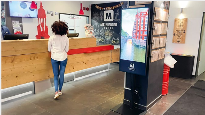
MEININGER Hotel, Hamburg