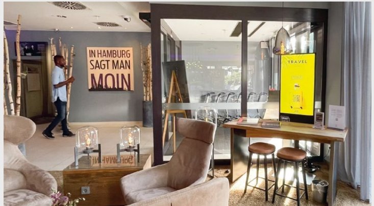
Mercure Hamburg City